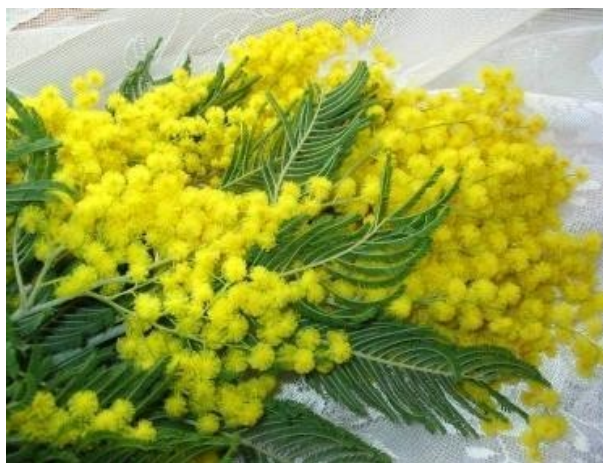
С душистой веточкой мимозы Весна приходит в каждый дом!

С праздником Весны, наши дорогие и любимые, с 8 марта!