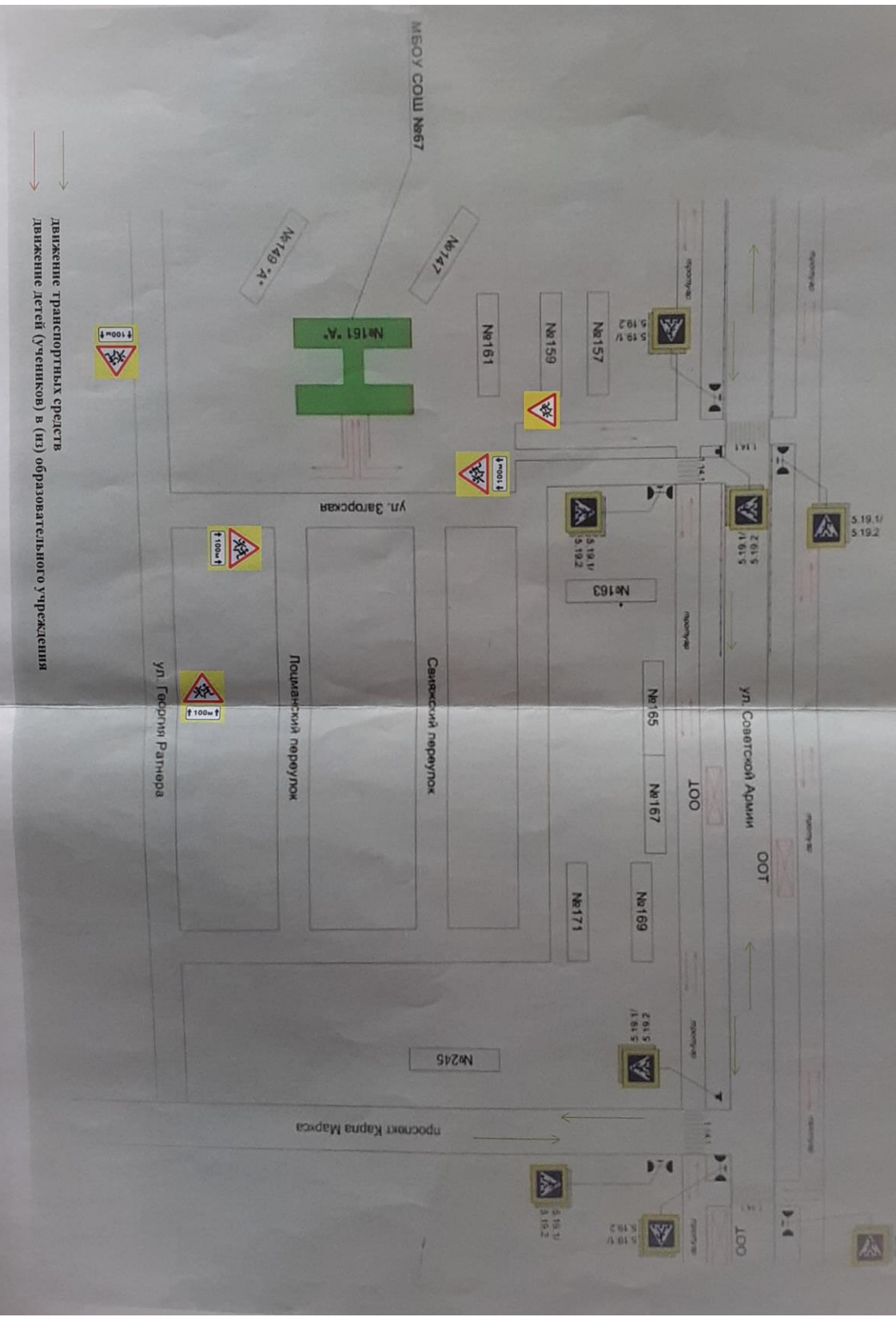
Приложение № 1 План-схема района расположения МБОУ Школы № 67 г.о. Самара, пути движения транспортных средств и детей (учеников)